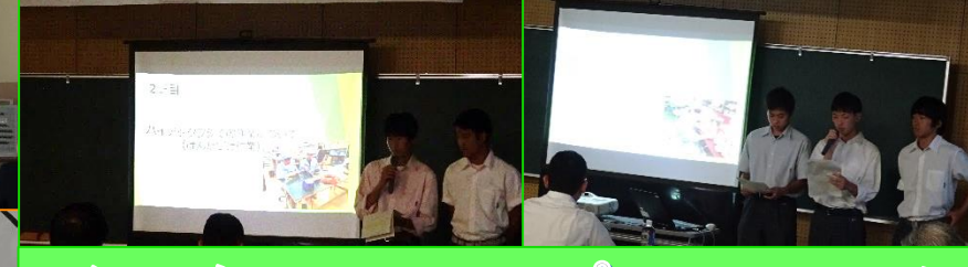
インターンシップフォーラム